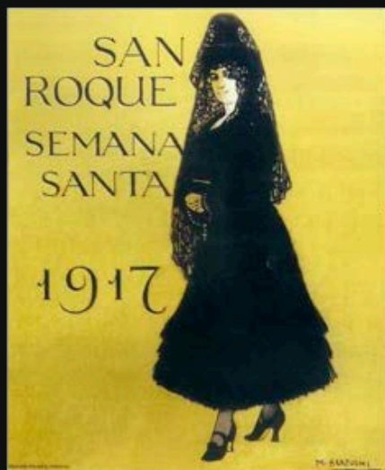
Cartel anunciador creado por M. Bertuchi