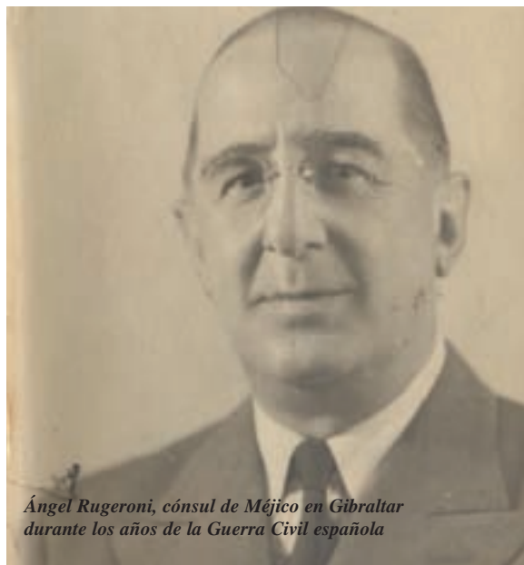
Ángel Rugeroni, cónsul de Méjico en Gibraltar durante los años de la Guerra Civil española

El trueque se frustró tras la llegada de las tropas nacionales a las cercanías de la capital momento en el que la hermana del general Queipo de Llano fue trasladada a Cartagena o