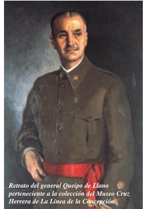
Retrato del general Queipo de Llano perteneciente a la colección del Museo Cruz Herrera de La Línea de la Concepción.