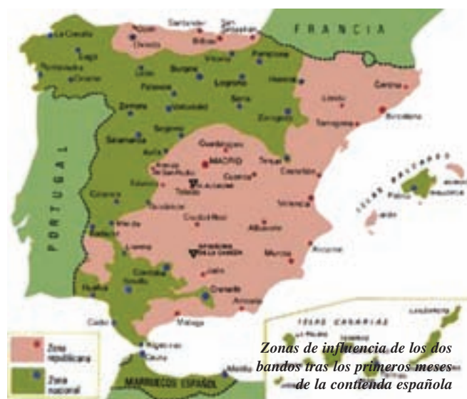
Zonas de influencia de los dos bandos tras los primeros meses de la contienda española